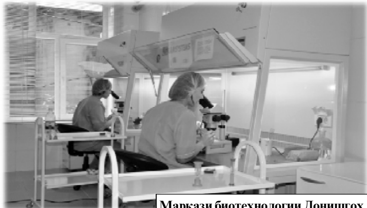
Маркази биотехнологии Донишгоҳ