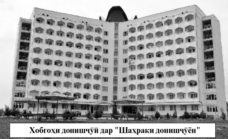
Хобгоҳи донишҷӯӣ дар "Шаҳраки донишҷӯён"

Донишгоҳи миллии Тоҷикистон маркази бузурги таълимию илмӣ ва фарҳангии Ҷумҳурии Тоҷикистон ба ҳисоб рафта, дар рушду такомули соҳаи илму маориф, баланд бардоштани маърифат, худшиносии миллӣ, ифтихори ватандорӣ ва тарбияи кадрҳои баландхатисос мақому манзалати хоса дорад. Дастпарварони ин боргоҳи илму маърифат дар пешрафти давлати мустақили Тоҷикистон, рушду равнақи соҳаҳои иқтисодиву иҷтимоӣ ва илмиву фарҳангии кишвар саҳми арзанда мегузоранд.