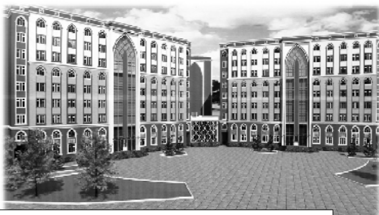
Лоиҳаи бинои нави хобгоҳ дар "Шаҳраки донишҷӯён"