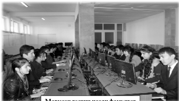
Маркази тестии назди факултет

☐ 2008 - Донишгоҳи миллии Тоҷикистон (ДМТ) (Фармони Президенти Ҷумҳурии Тоҷикистон аз 28.10.2008, №556).